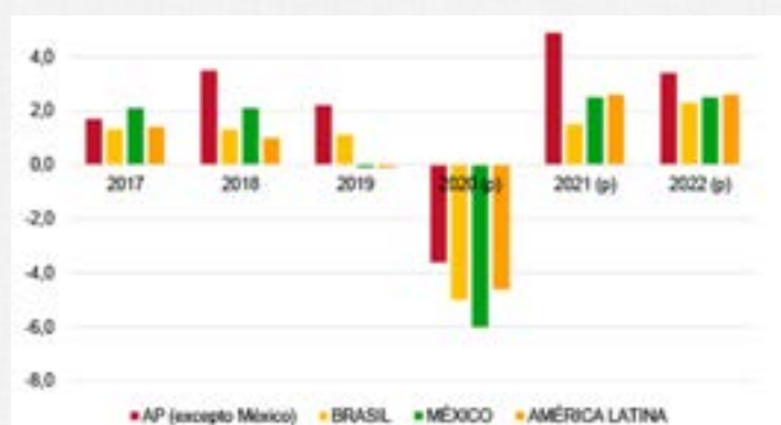
Previsión de crecimiento en América Latina para el periodo 2017 – 2022 (%) (Blanco, 2020: p.4)