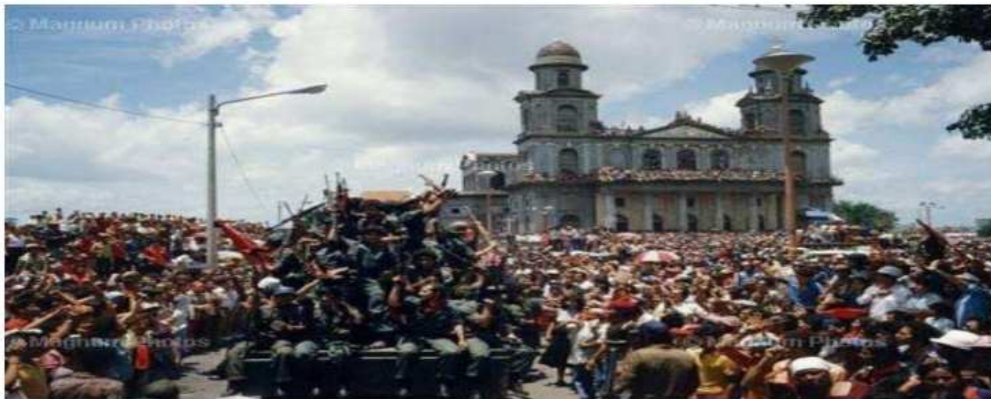
Figura 2. Entrada a la plaza central de Managua, Nicaragua, 20 de julio de 1979.

Fuente: LIMA, L.C.O. Orden productivo local de la banana orgánica. Informe de Investigación, Centro de Investigación y Postgrado en Agronegocios, ICHS/DCE. Seropédica, 2006.